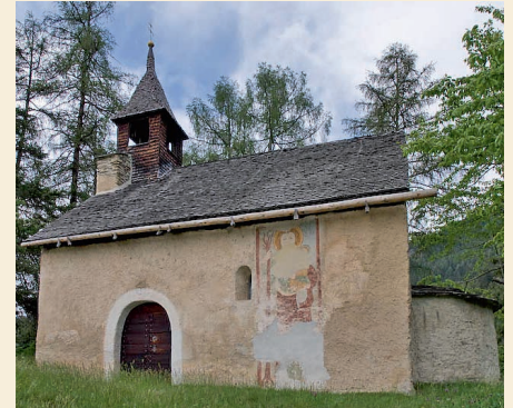
Die Kapelle St.-Maria-Magdalena oberhalb von Dusch.

Andacht. Lieder, Gebete, Musik und das Wort Gottes prägen diese Zeit. Im Anschluss an die Andacht gibt es vor der Kapelle noch eine kleine Stärkung für den Nachhauseweg und die Möglichkeit, den Abend beim gemütlichen Beisammensein ausklingen zu lassen. Die Erfahrungen eines solchen Abends können uns unter Umständen wieder ganz neu ins Bewusstsein rufen, welcher Segen auf unserem Leben liegt, wenn wir tatsächlich mit Gott unterwegs sind. (ab)