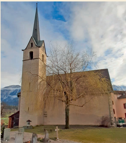
Zum ersten Mal findet eine ökumenische Wortgottesfeier in der Kirche Fürstenau statt.