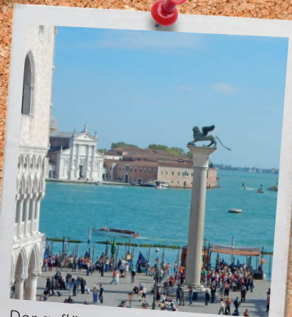
Der geflügelte Markuslöwe – Staatswappen von Venedig

... wir am 25. April den Tag des heiligen Evangelisten Markus feiern? Markus ist gemäss der altkirchlichen Tradition der Autor des wahrschein- lich ältesten Evangeliums, wobei der Evangelist seinen Namen selbst nicht nennt. Symbol des Evangelisten ist der Markuslöwe. In Venedig baute man ihm zu Ehren die Vorläuferkirche des Markusdoms, die 976 komplett niederbrannte. Die Gebeine des Markus wurden 1094 bei Beendigung des Baus des Mar- kusdoms «wiedergefunden». Der geflügelte Markuslöwe wurde zum Staatswappen der Republik Venedig,